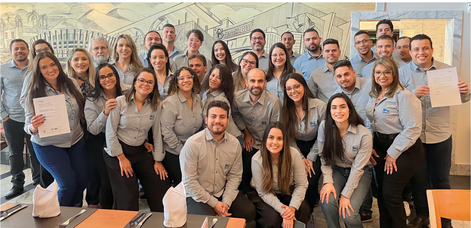
Equipe da matriz da Minas Mineração com o certificado ISO 9001 e o atestado de adesão à ISO 31000.

Sempre com foco no desenvolvimento sustentável e buscando a diversificação da sua oferta de serviços, a Minas Mineração também desenvolve pesquisas minerais para diversos setores.