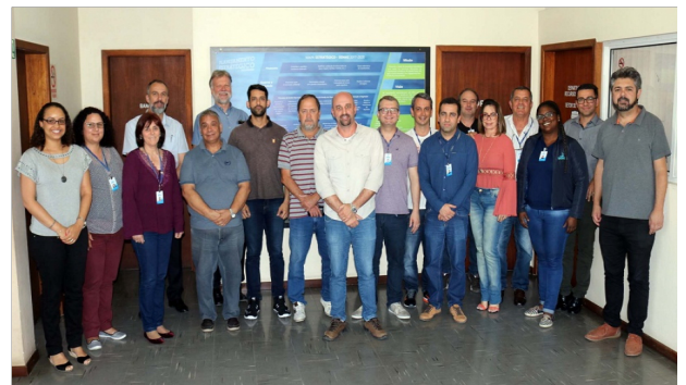
Grupo de trabajo de Semaes que coordinó la búsqueda del Premio Nacional a la Calidad del Saneamiento